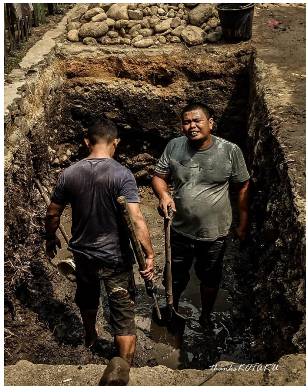
Foto-foto yang ditampilkan dalam ebook awal tahun 2020 ini adalah foto-foto saat kunjungan lapangan dan hasil kolektif tim di propinsi. Foto-foto tersebut umumnya diambil dengan menggunakan kamera smartphone . Hasil jepretan dengan kamera smartphone tersebut kemudian di editing dengan menggunakan lightroom .

Melalui fotografi human interest , coba untuk menonjolkan berbagai ekspresi dan dinamika warga masyarakat lokasi sasaran program dalam mengimplementasikan kegiatan mewujudkan kampung bebas dari kumuh. Yang menjadi objek foto adalah warga masyarakat baik itu dewasa maupun anak-anak yang sedang mengerjakan kegiatan fisik ataupun menikmati perubahan kampungnya.